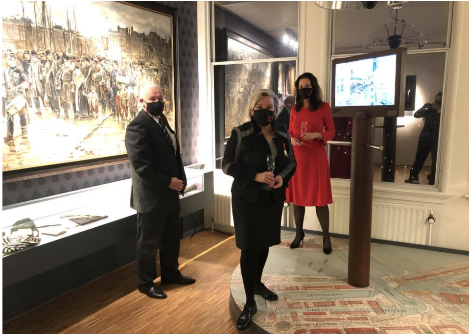
Minister Bijleveld, Directeur Mariniersmuseum en Uw voorzitter bij de Panorama 360°

We zien uit naar een ( corona proof ) gelegenheid onze donatie formeel over te kunnen dragen aan het museum.